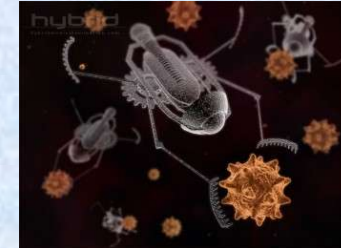
Майбуття наноелектроніка: медичні нанороботи мандрують кровоносною судиною та атакують віруси