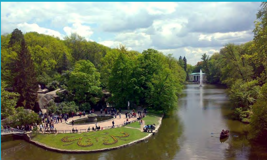
Парк Софіївка в Умані