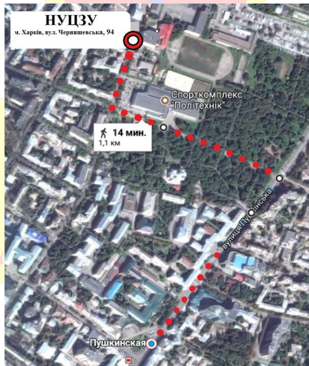
Схема маршруту від станції метро «Пушкінська» до університету (вул. Чернишевська, 94)

Проїзд від залізничного вокзалу до станції метро «Пушкінська»: на залізничному вокзалі посадка на станції метро «Південний вокзал», проїзд до станції «Майдан Конституції», перехід на станцію «Історичний музей», проїзд до станції «Пушкінська».