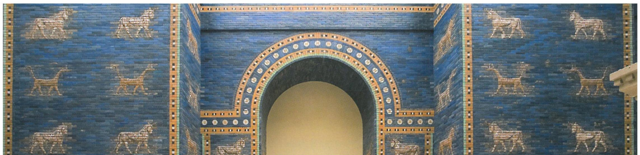
Рис. 1. Закономерности генези образу вавилонської вежі