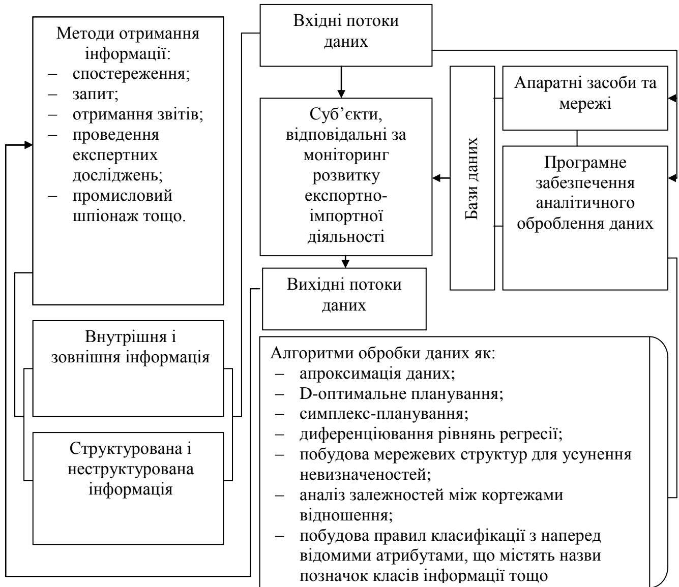
Рис. 2. Модель інформаційного забезпечення моніторингу розвитку експортно-імпоротної діяльності машинобудівного підприємства на прикладі ПАТ «Конвеєр» Примітка: розроблено дисертантом

На рис. 2 побудовано систему інформаційного забезпечення моніторингу розвитку експортно-імпоротної діяльності підприємства на прикладі ПАТ «Конвеєр».