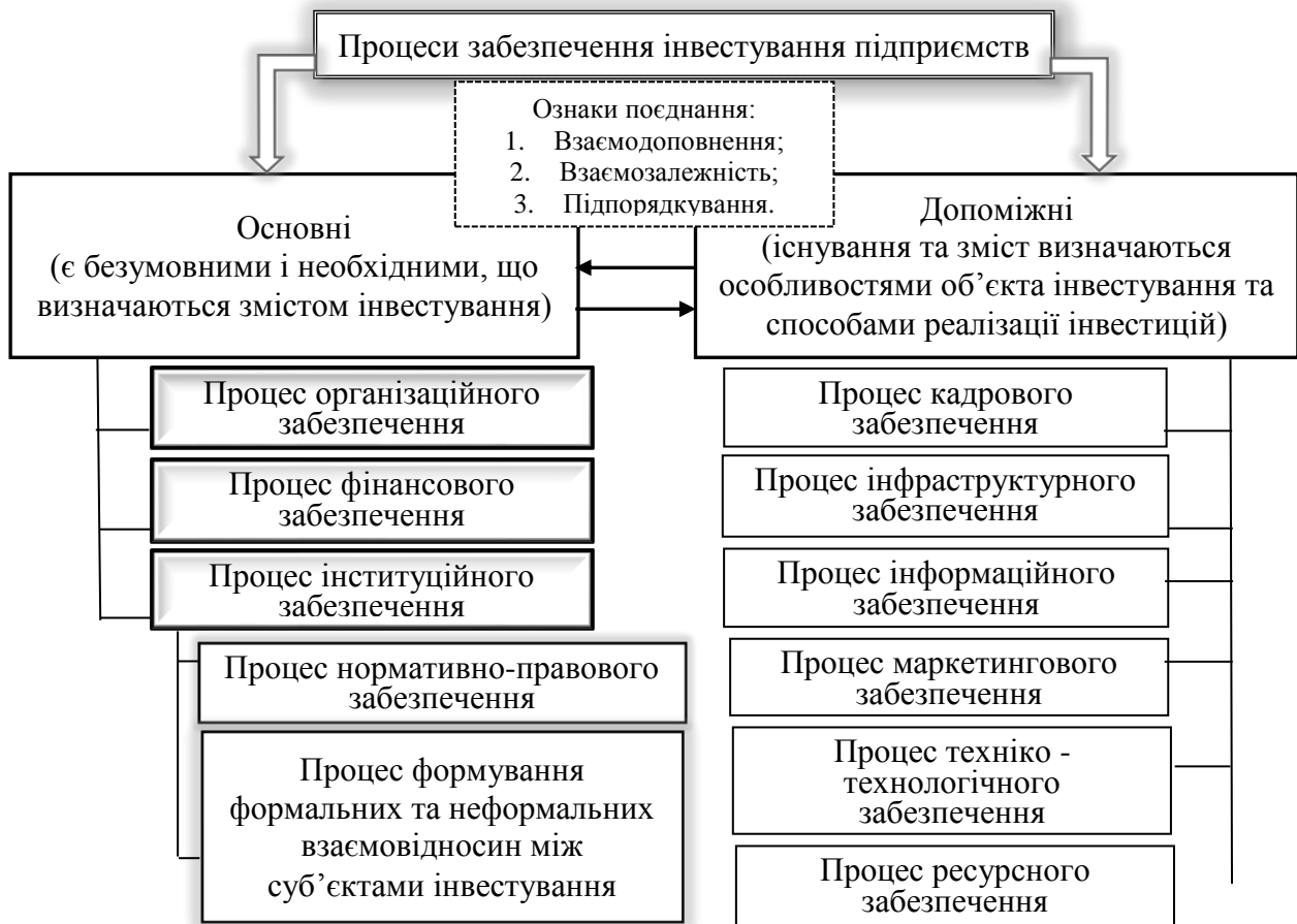
Рис. 2. Класифікація процесів забезпечення інвестування підприємств