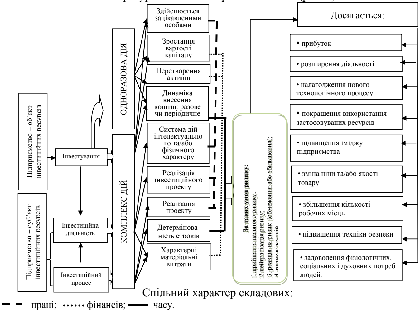
Рис. 1. Термінологічний взаємозв'язок категорій «інвестиційна діяльність», «інвестування», «інвестиційний процес» в контексті суб'єктів господарювання Примітка: розроблено автором

Проведені дослідження виявили суттєві відмінності у дефініціях категорій «інвестиційний процес», «інвестування» та «інвестиційна діяльність», трактування яких в економічній літературі залишається різноплановим (рис. 1).