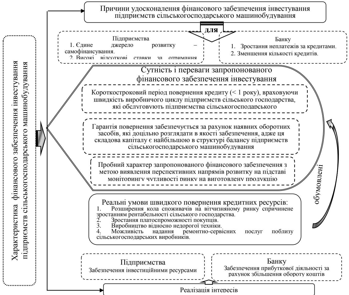
Рис. 4. Структурно-логічна модель фінансового забезпечення інвестування підприємств сільськогосподарського машинобудування