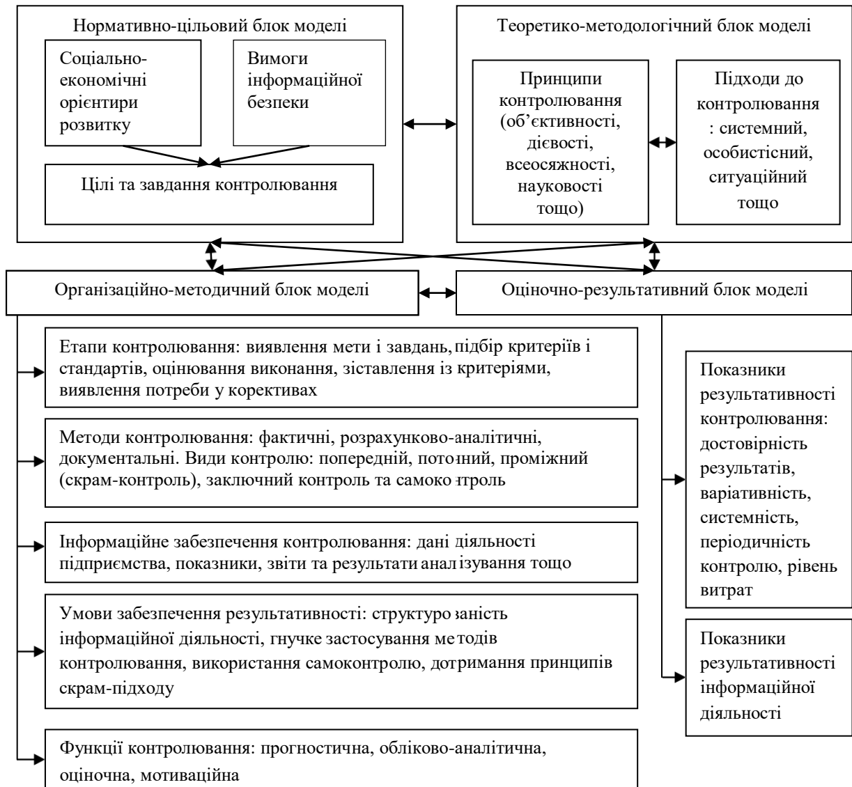
Рис. 3. Системно-функціональна модель контролювання інформаційної діяльності підприємств

З метою забезпечення результативного управління інформаційною діяльністю підприємства шляхом оцінювання рівня виконання завдань та поставлених цілей інформаційної діяльності підприємства у дисертації розвинуто системно-функціональну модель контролювання (рис. 3).