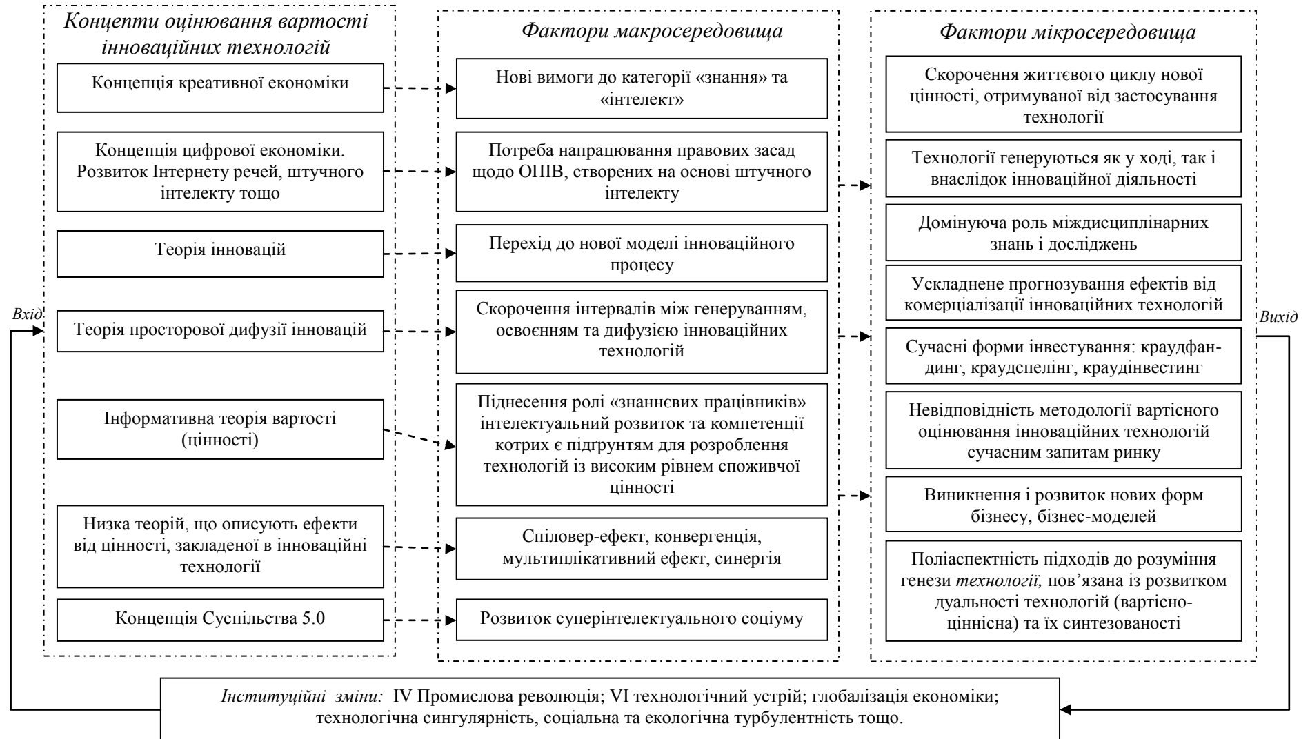
Рис. 1. Передумови оцінювання вартості інноваційних технологій

Примітки: систематизовано автором; умовні позначення: - - - - - – основні складові середовища системи, - ► – напрямок впливу концептів і факторів.