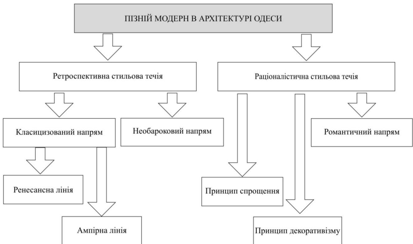
Рис.2 Стиліві течії, напрями і лінії пізнього модерна Одеси.

Ключевые слова: архитектура, стиль, поздний модерн, доходные дома, архитектурная композиция, планировка здания, объемно-пространственная композиция, пластика, 1906-1914 г.